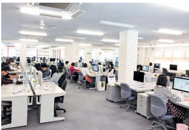
新潟支社作業フロア

仮にどちらかの拠点が大規模災害に見舞われたとしても、大切なデータを消失することはなく、もう一方の拠点ですぐに作業を再開させることができるため、